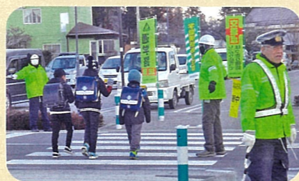
「年末の交通安全運動」で、通学路において児童に対する見守り活動を実施した。(池田松川)