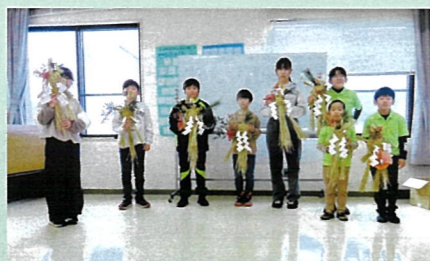
「年末の交通安全運動」で、少年部による交通安全を祈願した「正月飾り作成研修会」を開催した。(安曇野)