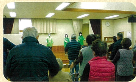
管内の公民館において高齢者に対する交通安全教室を開催した。(小諸)