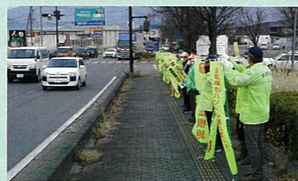
「年末の交通安全運動」の活動で、松代大橋前県道において街頭啓発活動を実施した。(長野南・松代)