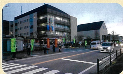
「年末の交通安全運動」で、諏訪警察署前において街頭啓発活動を実施した。(諏訪)