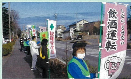
「年末の交通安全運動」で、御代田町内の県道において飲酒運転防止などを呼び掛けた。(佐久)