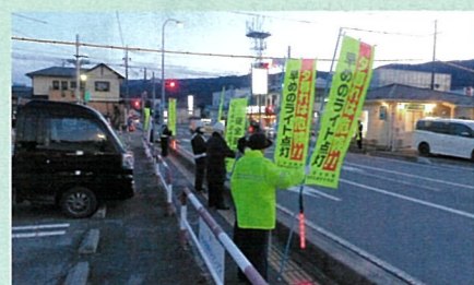
「年末の交通安全運動」で、市役所西県道交差点において街頭啓発活動を実施した。(茅野)