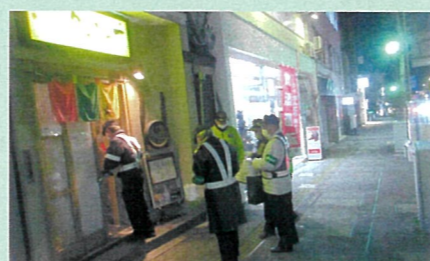
「年末の交通安全運動」で、飲食店を対象とした「飲酒運転防止パトロール」を実施した。(飯伊)