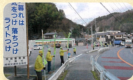
「年末の交通安全運動」で、管内の国道において街頭啓発活動を実施した。(阿南)