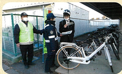
「年末の交通安全運動」の活動で、管内の高校において自転車ヘルメットの着用啓発を実施した。(須高)