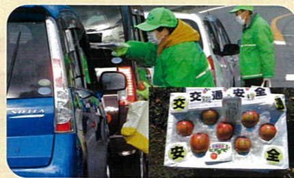
「年末の交通安全運動」で、ドライバーに「交通安全文字入りりんご」を手渡して交通事故防止を指導した。(川西)